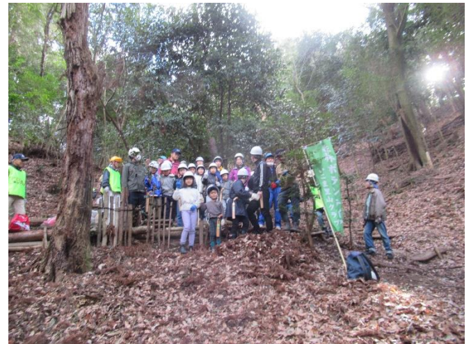
60年前までは冬の仕事は落ち葉を掻きで、1年分の焚付けを小屋にためていた。そして松茸がとれた